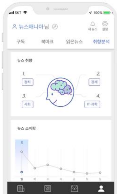
주요 뉴스, 개인 맞춤형 뉴스로 차별화된 서비스 도입 『뉴썸』