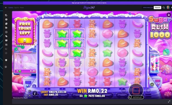
Hype247 게임 화면 (테스트 환경)

자체 슬롯 게임 개발팀 구성 글로벌 GP 파이프라인 확보 자체 IP 기반 높은 마진 구조